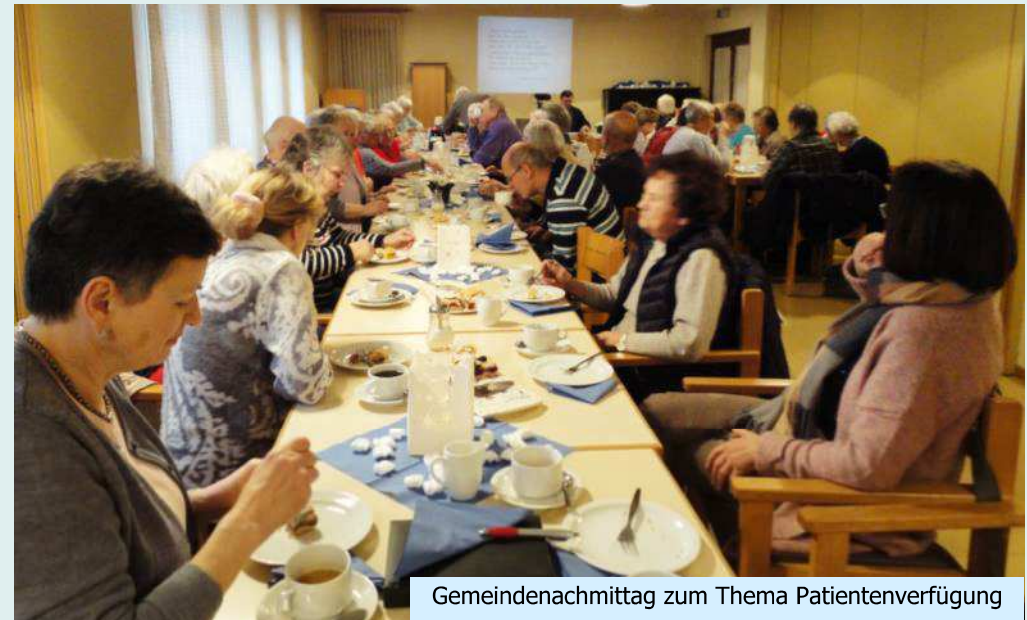
Gemeindenachmittag zum Thema Patientenverfügung