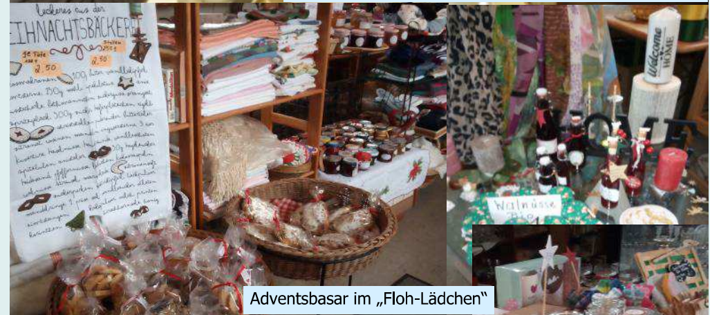
Adventsbasar im „Floh-Lädchen“