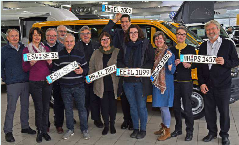
BONI-Bus-Vergabe in Padeborn