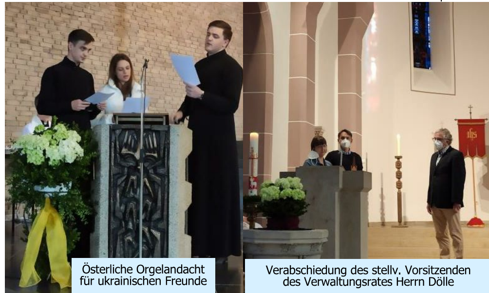
Österliche Orgelgandacht für ukrainischen Freunde