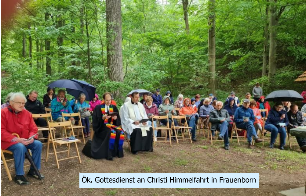
Ök. Gottesdienst an Christi Himmelfahrt in Frauenborn