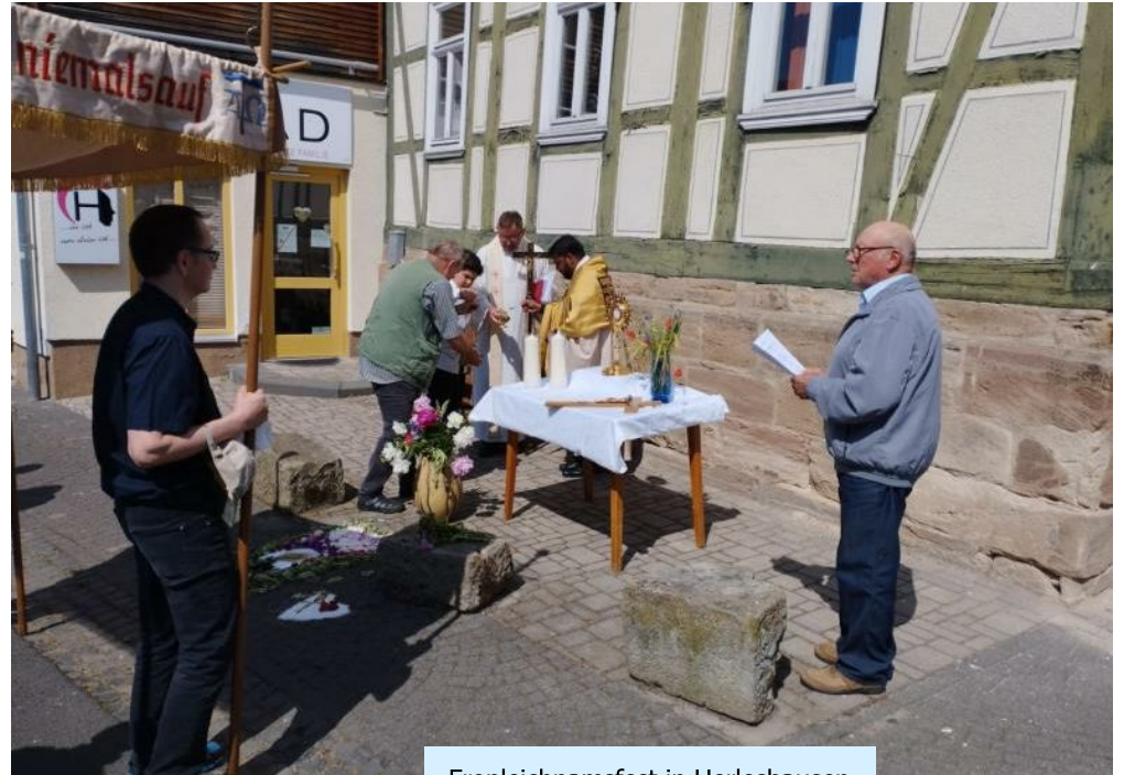
Fronleichnamsfest in Herleshausen