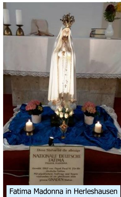
Fatima Madonna in Herleshausen