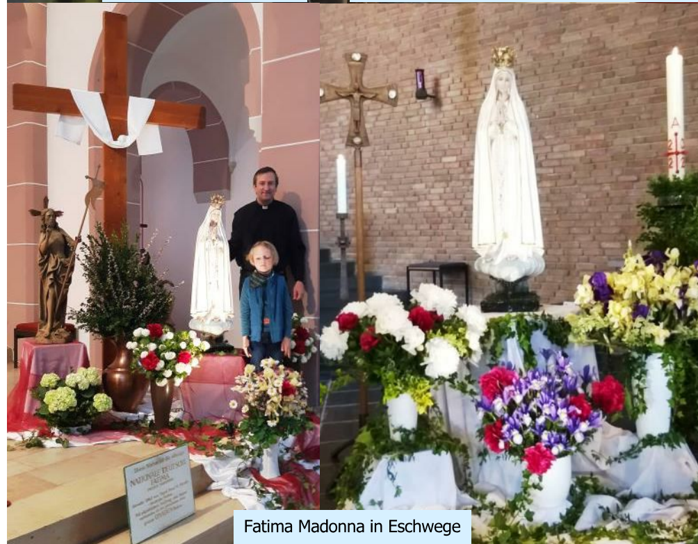
Fatima Madonna in Eschwege