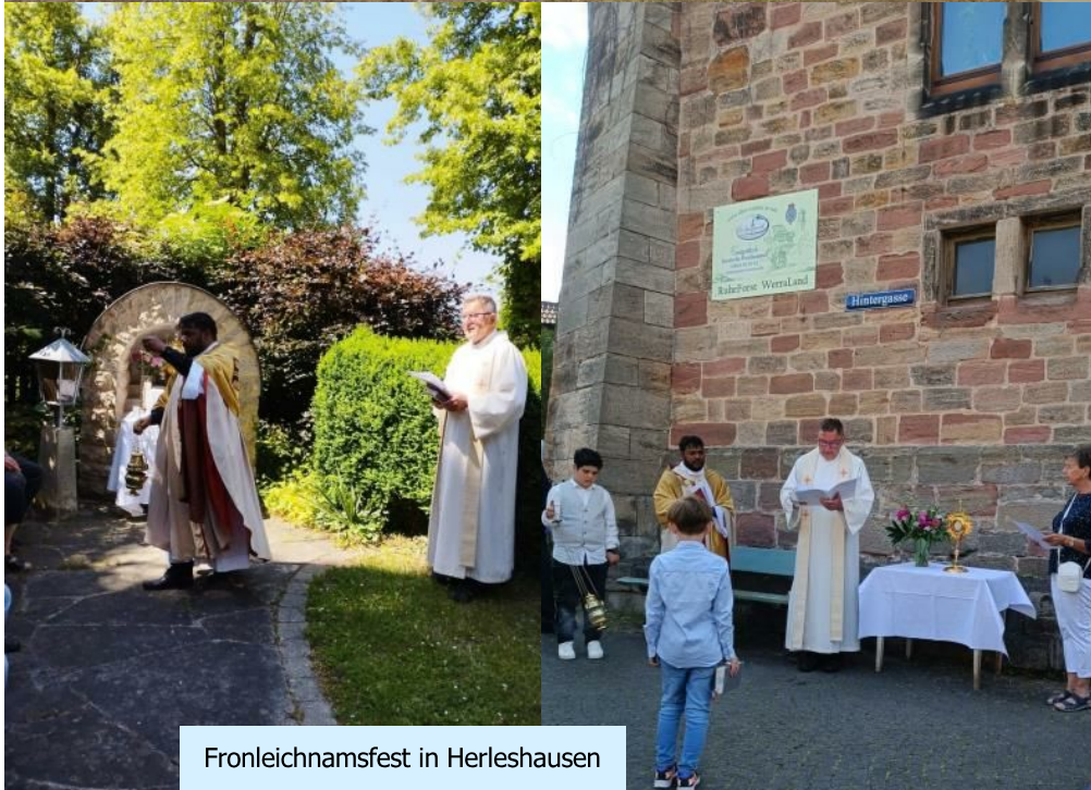
Fronleichnamsfest in Herleshausen