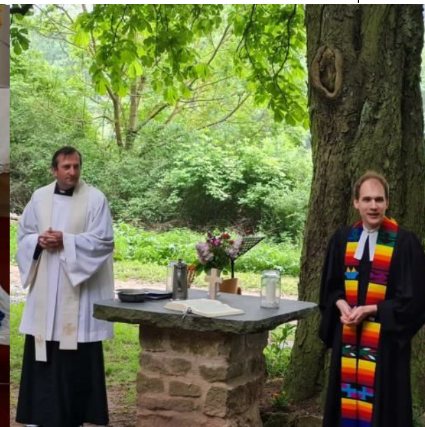
Ök. Gottesdienst an Christi Himmelfahrt in Frauenborn