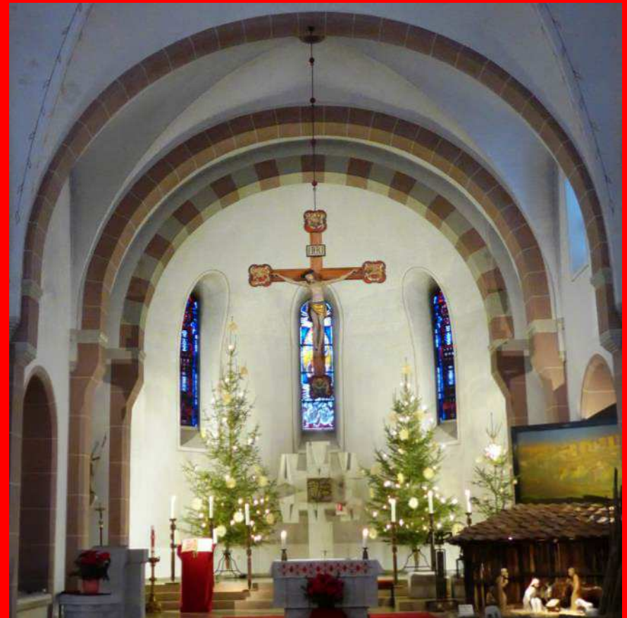
Der Altarraum der Kirche St. Elisabeth wird renoviert (siehe Seite 8).