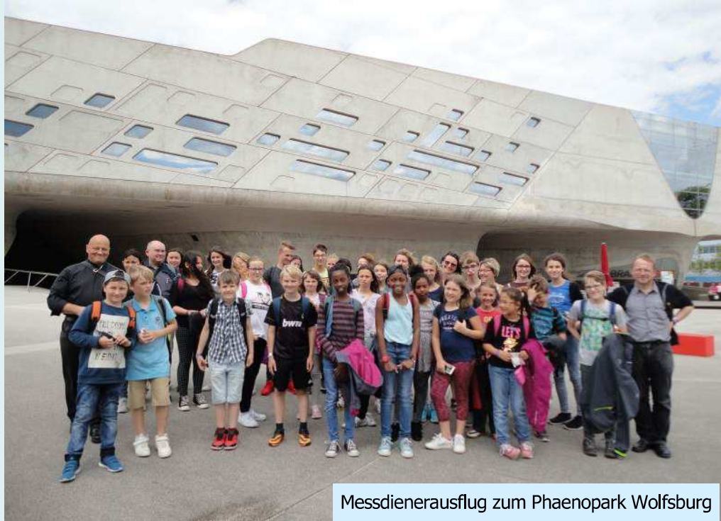
Messdienerausflug zum Phaenopark Wolfsburg