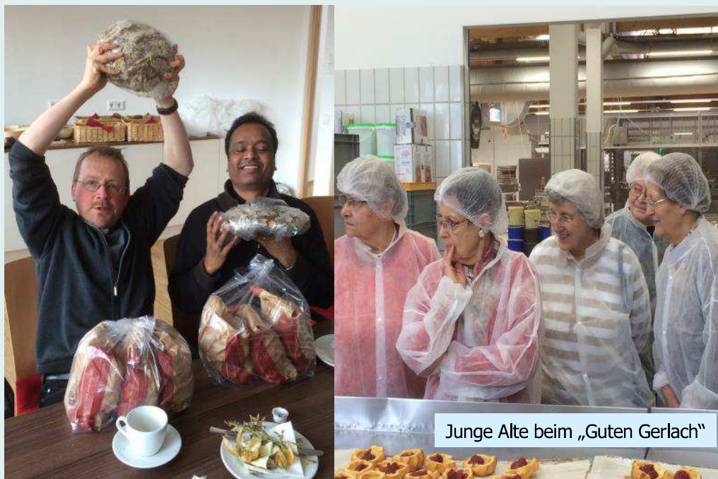
Junge Alte beim „Guten Gerlach“