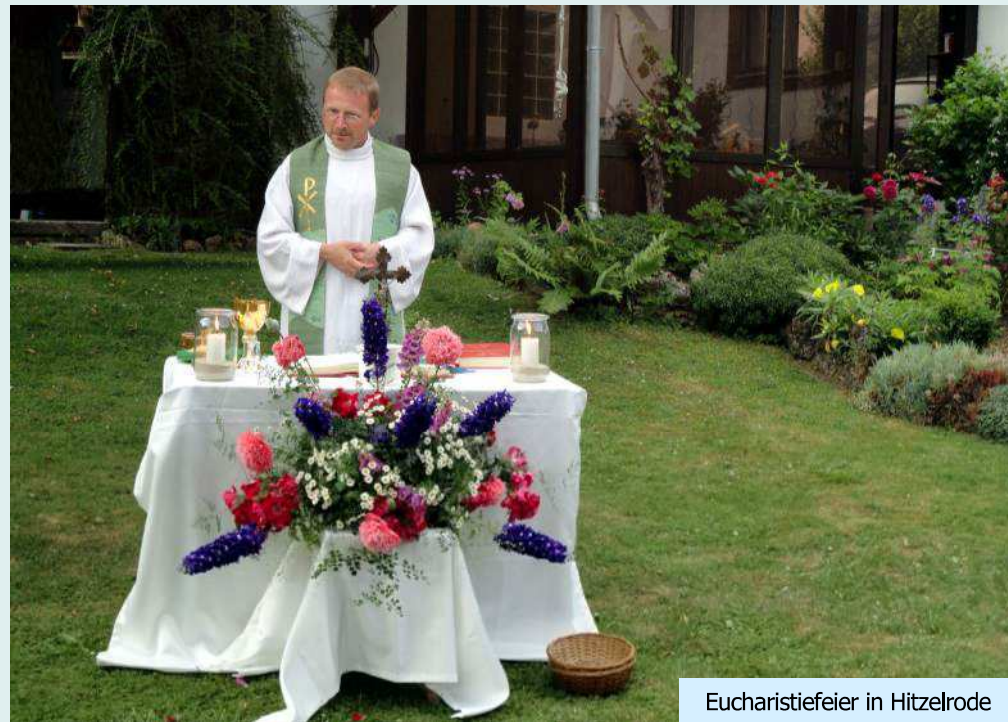
Eucharistiefeier in Hitzelrode