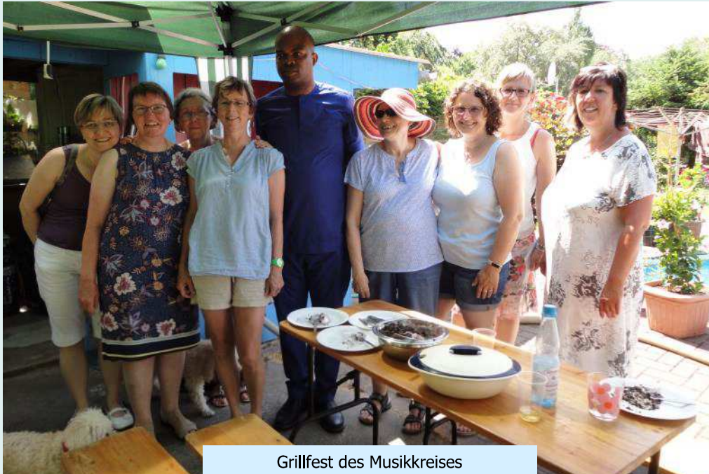
Grillfest des Musikkreises