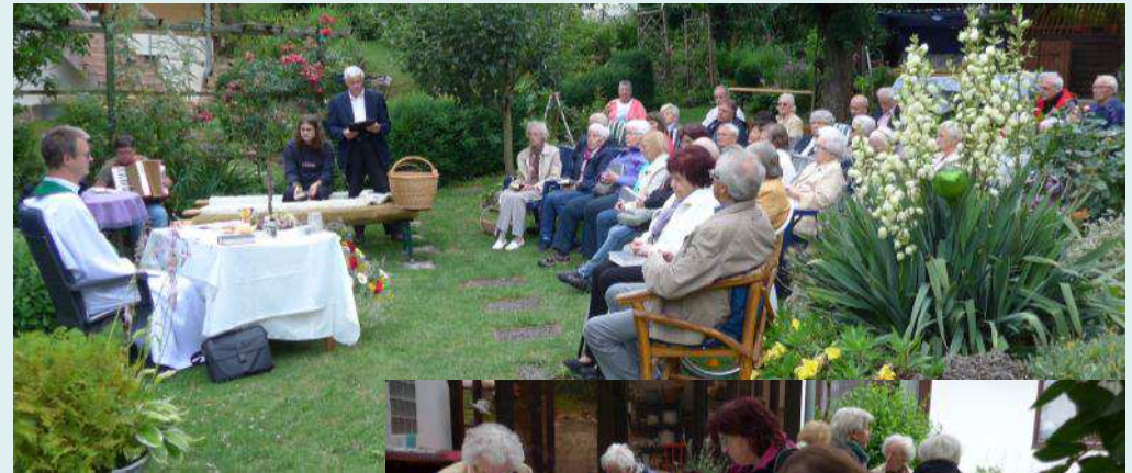
Hl. Messe im Garten der Fam. Rieping