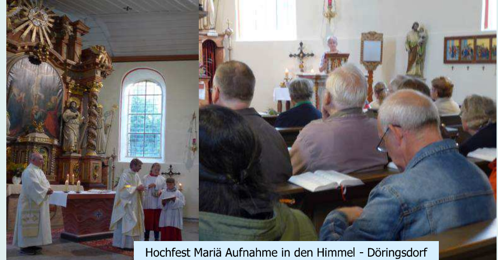
Hochfest Mariä Aufnahme in den Himmel - Döringsdorf