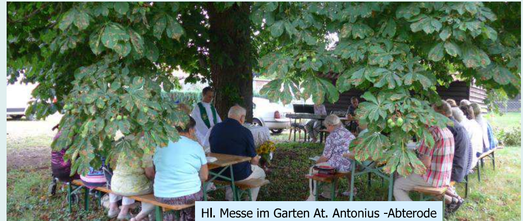
Hl. Messe im Garten At. Antonius -Abterode