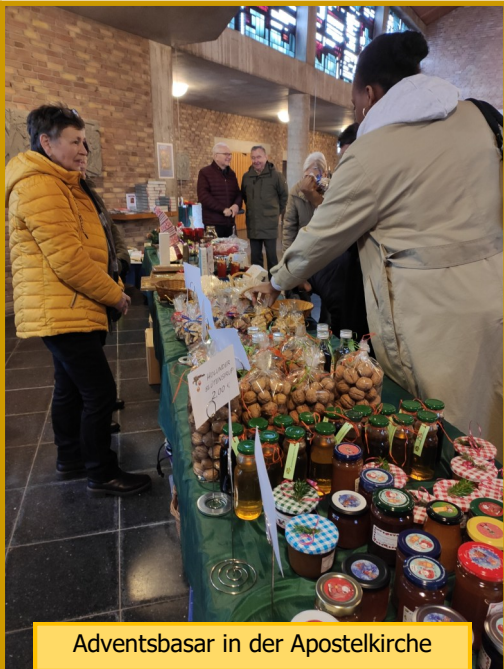
Adventsbasar in der Apostelkirche