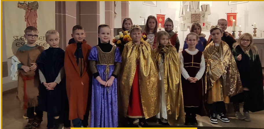
Gottesdienst zum Patrozinium