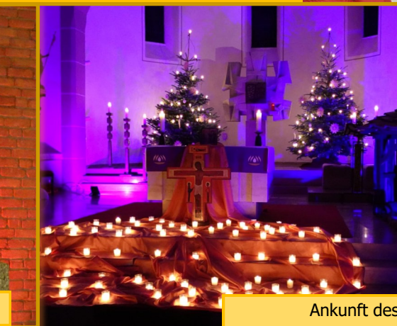
Ankunft des Friedenslicht