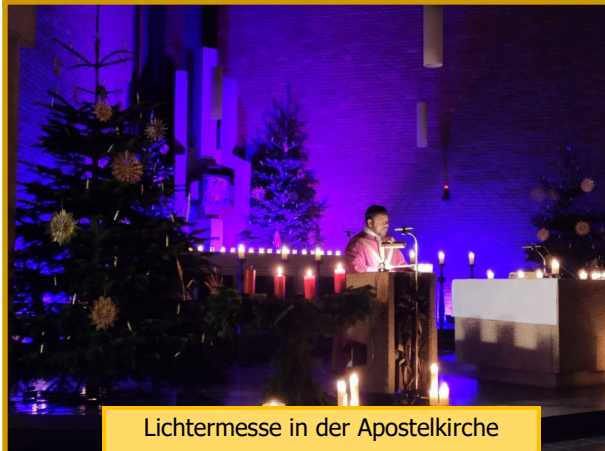
Lichtermesse in der Apostelkirche