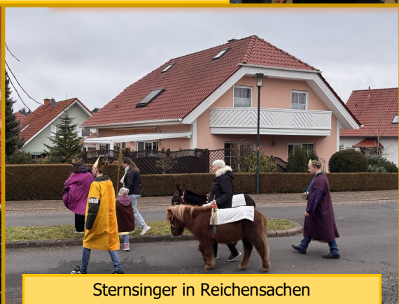
Sternsinger in Reichensachsen