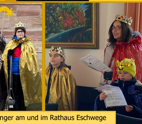
Sternsinger am und im Rathaus Eschwege